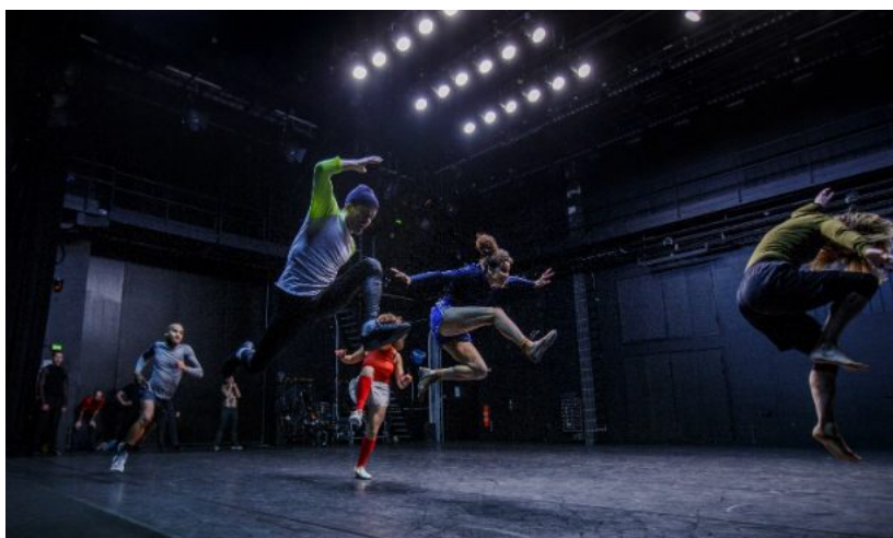
Jerada, Carte Blanche, 2017, foto av Arash Nejad.