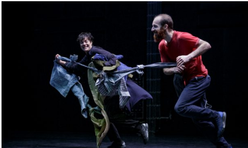
Jerada, Carte Blanche, 2017, foto av Arash Nejad.

Klær er et sentralt element i Jerada . Det begynner med anonyme, svarte klær, så blir paletten gradvis brutt opp av andre farger, et par røde sokker, en rosa bluse. Samtidig er klærne en sterk identitetsmarkør, og det gir en fin effekt når de løper i ring, bytter plagg og kaster dem både til og på hverandre. Plaggene blir flere og flere, det ender i et virvar av ulike kleskoder, fra treningsshorts til slør, fra sydvester til leopardmønstrede kåper. Også her går effekten over i det komiske, når en av danserne dumper et helt lass med fargerike klær på gulvet. De andre kaster seg over haugen og slenger klesplagg veggimellom med en villskap du ellers bare ser på Black Friday. Selv om forløpet virker kaotisk og tilfeldig, merker man en imponerende rytme og presisjon i bevegelsene. Som koreograf vet Ouizguen hva hun gjør, uten at det gjør det enklere å sette ord på.