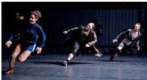
HØYT TEMPO: Tempoet i forestillingen bygges gradvis opp, og sirkelene danserne jobber i, blir større og større.

Kulturredaktør FRODE BJERKESTRAND mobil 97978700 Nyhetsleder TONJE AURSLAND tlf. 55 21 45 22 e-post: kultur@bt.no/debatt@bt.no